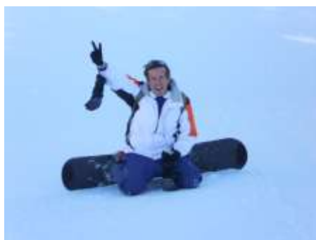
Encadrement du snow-board

Uniquement pour les jeunes sachant déjà faire du snow-board