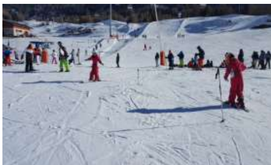
Initiation pour les débutants