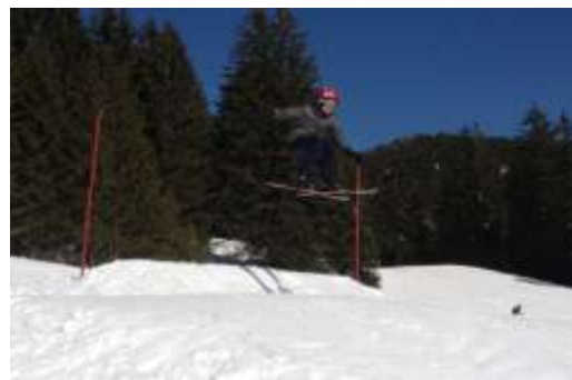
Encadrement des plus aguerris par groupes de niveau